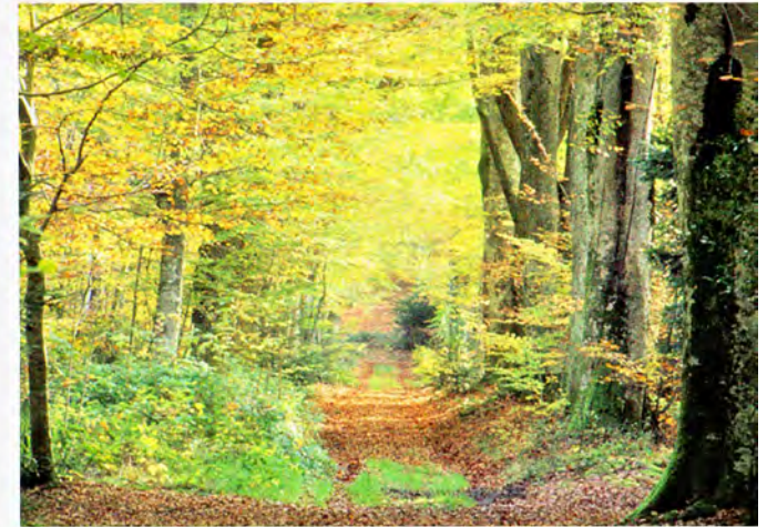
La forêt des Liards, près du château de Liberty.

4 h 30 - 16 km balisage vert dénivelée : 562 m ▼ 650 m ▲ 863 m