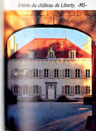
Entrée du château de Liberty. -MS-

■ Château de Liberty, XVIII e ; château de Meydat ; anciens moulins ✕ hautes futaies de feuillus ★ vallée de l'Astroux. À PROXIMITÉ : 🏰 Sauxillanges 🏰 château d'Échandelys. 📍 Saint-Germain-l'Herm.